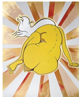
Beppe Volpini La Sole

La mostra si propone di offrire una serie di strumenti attraverso i quali il visitatore potrà riflettere sul valore del corpo oggi, nelle sue valenze di oggetto e soggetto delle attività umane, attraverso un ideale percorso che partendo dal corpo-icona, eredità di Warhol, attraversa le sue quotidiane trasformazioni estetiche, fino a giungere ad un corpo shock, trasformato completamente nella sua intima natura. Gli artisti hanno affrontato quest'attuale tematica con i mezzi e le tecniche della cartellonistica pubblicitaria, della comunicazione di strada, del design, del reportage; tutte modalità che sono entrate di gran forza e da tempo nella sfera delle discipline artistiche e che sottolineano come il corpo dell'uomo e della donna siano oggi uno strumento di comunicazione, un oggetto da