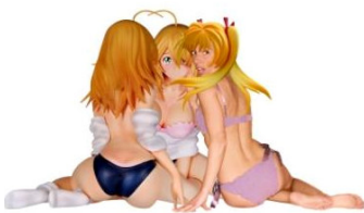
Alessandro Pianca Poison Dolls